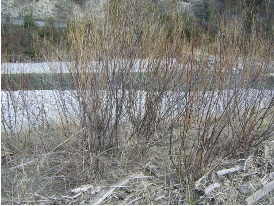
Frühlingsaspekt des Weiden-Tamariskengebüsch auf etwas erhöhten Au-Niveau (April 2007)