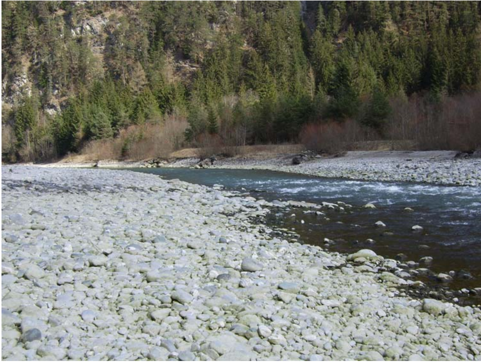
durch Schwallbetrieb beeinflusste Restwasserstrecke des Inn bei Pfunds (April 2007)